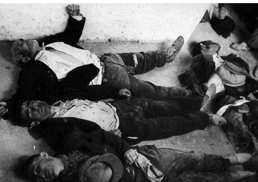
Arriba: una de las muchas imágenes de la masacre en Casas Viejas.