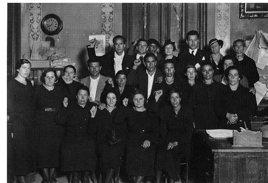
Arriba: detenidos, al parecer militantes del partido comunista, en la manifestación del uno de mayo de 1934. Abajo: mujeres y viudas de mineros asturianos detenidos o muertos en octubre del 34 posan para la prensa.