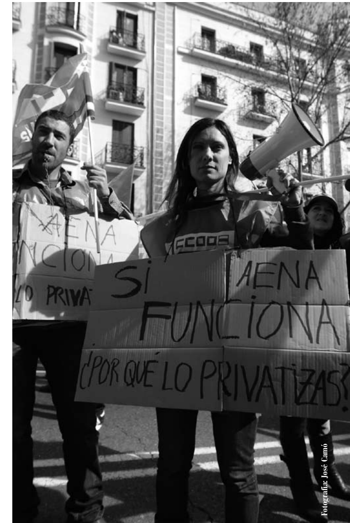
Manifestación estatal contra la privatización de AENA. 26 de febrero de 2011, Madrid.

Ahora bien, no nos podemos contentar con eso. Es necesario profundizar en esa dirección. También tenemos que posibilitar activamente la máxima unidad de la izquierda que lucha contra los planes del Gobierno y Patronal en cada acción que convoquemos. Tenemos que recuperar la calle a golpe de octavilla, como decía el compañero Cayo Lara. Tenemos que implicarnos abierta y organizadamente en la vida de los barrios y los sindicatos, en las movilizaciones de la juventud que se han desarrollado en las últimas semanas, proponer una respuesta de movilización frente a la ofensiva de la derecha y la Patronal. Sólo así lograremos ilusionar y ganar el apoyo activo de jóvenes y trabajadores