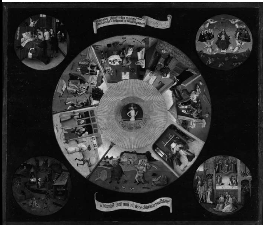
Mesa de los pecados capitales. El Bosco .

“La enfermedad del sistema se manifiesta en todos los niveles. Seis siglos después, El carro del heno aún sigue rodando, aplastando hombres y mujeres bajo sus pesadas ruedas. La alienación capitalista y el fetichismo de las mercancías han ocupado tal espacio en nuestras psicologías que ni siquiera somos conscientes de ello.”