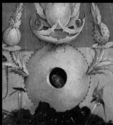
Cinco detalles del tríptico, El jardín de las delicias. (Museo del Prado, Madrid).