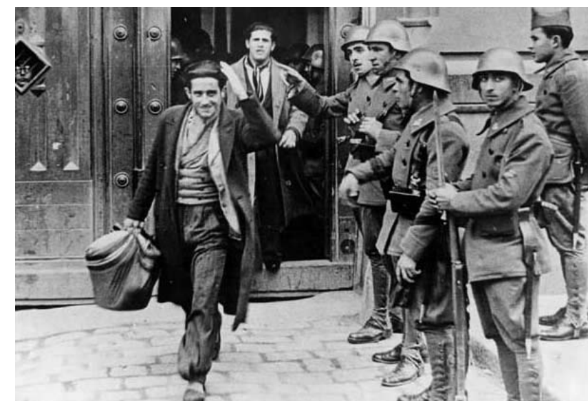
Arriba: una multitud celebra en la plaza de la Gibeles, Madrid, el triunfo electoral del Frente Popular. Abajo: salen amnistiados a la calle presos de los acontecimientos de octubre.