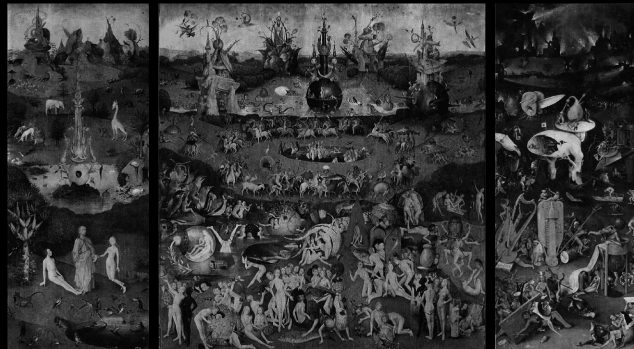
La obra maestra de El Bosco: Tríptico, El jardín de las delicias. (Museo del Prado, Madrid).

“En Alemania el arte gótico tardío comenzó a reflejar el nuevo espíritu de la Italia renacentista. Pero mientras que el arte italiano está preñado de luz y sol, el arte alemán de estos tiempos es oscuro, su tema sombrío, y su estilo, grotesco. Este arte está suspendido entre dos mundos. Tiene un carácter transitorio porque es hijo de una época de transición entre feudalismo y capitalismo.”