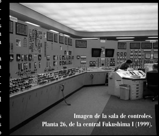
Imagen de la sala de controles. Planta 26, de la central Fukushima I (1999).

se da un accidente en uno solo de los reactores, pues entonces fácilmente (como evidencia dramáticamente Fukushima I), los problemas de un reactor se trasladan al resto. Nuevamente, el obtener el máximo rendimiento económico de los propietarios se pone por encima de la seguridad colectiva. Sucede lo mismo con la ubicación de tantos reactores al lado del mar en el país que dio nombre al tsunami. La razón estriba en que no hay que pagar por el agua del mar, sale muy barata, rebaja costes y aumenta beneficios, especialmente en un país sin ríos de caudal importante.